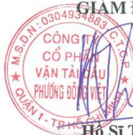
Hồ Sĩ Thuận